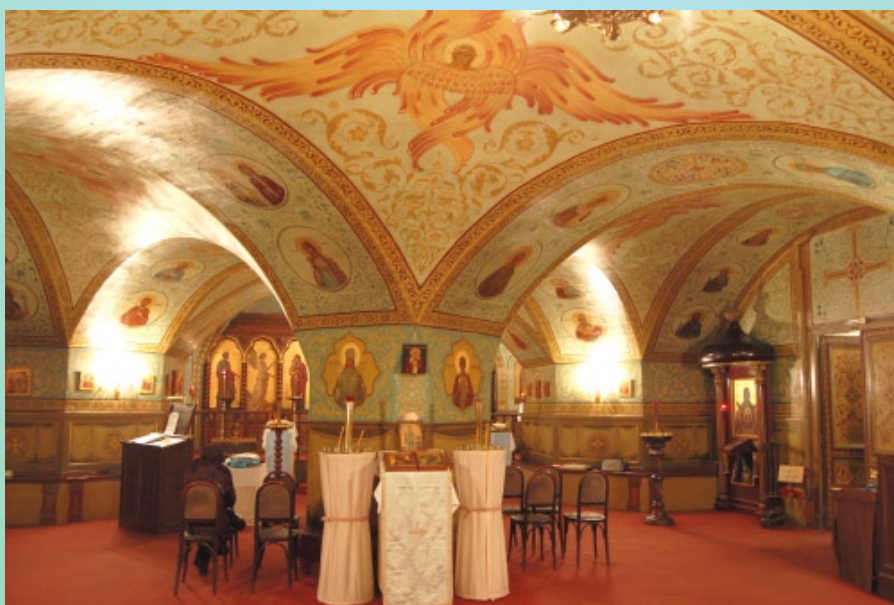
Parigi, Cattedrale Sant'Alexander Nevskij, cripta