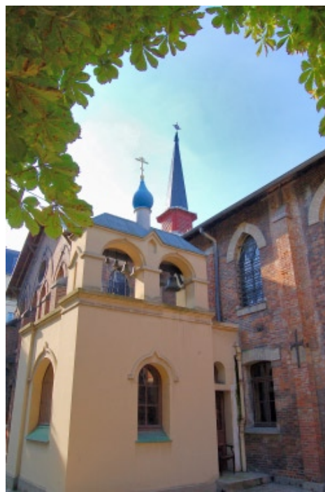
Parigi, Istituto Saint-Serge, Chiesa di San Sergio

Dall'anno scorso l'Istituto organizza di concerto con l'associazione «Catéchèse orthodoxe» delle giornate interconfessionali di catechesi che radunano una quarantina di persone attive nella catechesi di bambini e adolescenti nelle parrocchie. I due colloqui già svoltisi hanno visto il confronto sull'organizzazione, il metodo e i programmi di insegnamento catechetico.