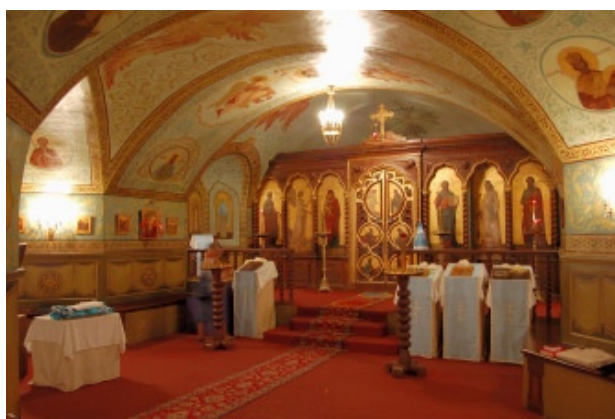
Parigi, Cattedrale Sant'Alexander Nevskij, veduta della cripta, dedicata alla SS. Trinità

этих стран, а священнослужители из Западной Европы. С 2003 г. мая копию возвысокопрегавриил Кокоторый сам Бельгии. В нахоятся Православв-