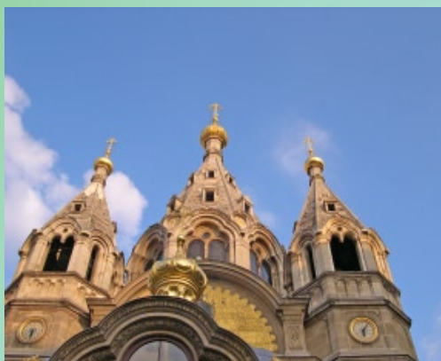
Parigi, Cattedrale Sant'Alexander Nevskij