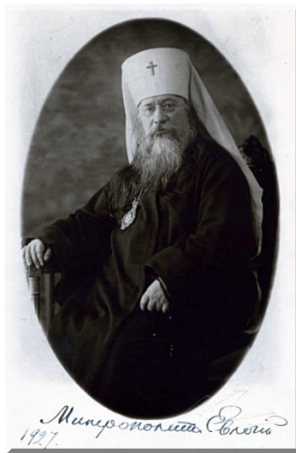
Il Metropolita Evlogij

L'Arcivescovado nacque come successore legale e canonico dell'Amministrazione provvisoria delle parrocchie russe in Europa occidentale fondata dal patriarca di Mosca san Tichon e affidata all'Arcivescovo Evlogij (Georgievskij) nel 1921. Questa Amministrazione aveva il compito di guidare le parrocchie russe in Europa occidentale nel difficile periodo successivo alla Rivoluzione d'Ottobre (1917). Evlogij, elevato al rango di Metropolita, stabilì la sua sede a Parigi, da dove iniziò a guidare un'arcidiocesi che si estendeva sull'intero territorio tale ed era destinata principalmente per effetto degli esuli russi, i quali si rare in Occidente la tradizione ortodossa in patria: alle vecchie diocesi arrivò a contare nel 1938, centodieci territori che andavano dal Marocco, da Londra alla Cecoslovacchia. Il grosso delle parrocchie (70) si trovava in