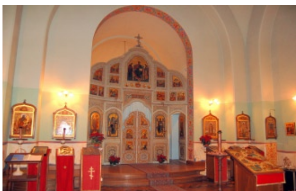
Chiesa di Sanremo, veduta dell'interno: l'iconostasi