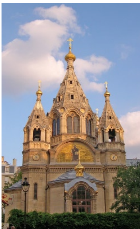
Parigi, Cattedrale Sant'Alexander Nevskij

divenuta punto di riferimento dell'emigrazione russa, si trovò presto nella situazione di non poter più mantenere rapporti normali e liberi con la sua Chiesa madre, fintantoché la situazione non degenerò in conflitto e quindi in rottura. Nel 1927 di Nijni-Novgorod, del trono patriarcale sotto le pressioni del dell'emigrazione di contro-rivoluzionalealtà verso il regime ancora sotto il ricatto il metropolita Sergij del metropolita Evloto, a Londra, a delle niche di preghiera in russa perseguitata. Il si appellò a questo ecumenico di Coninter pares nell'epiallora Sua Santità conobbe gli estremi