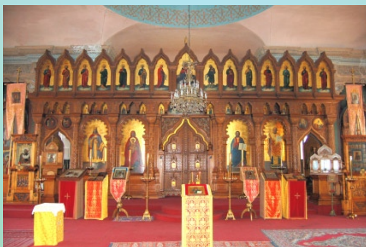
Nizza, Chiesa di San Nicola e Santa Alexandra