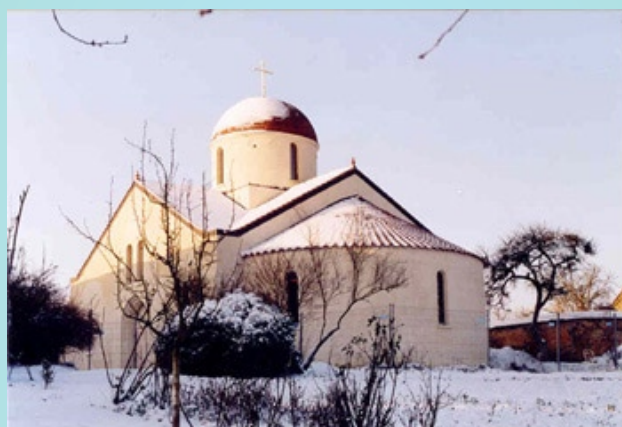
Bussy-en-Othe, Monastero Notre-Dame-de-Toute-Protection