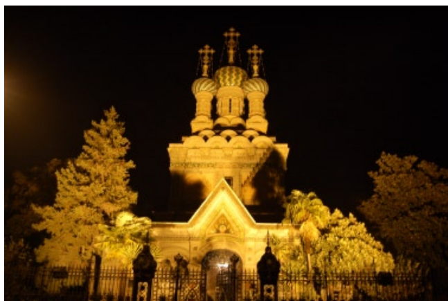
Firenze, Chiesa della Natività di Cristo e di San Nicola