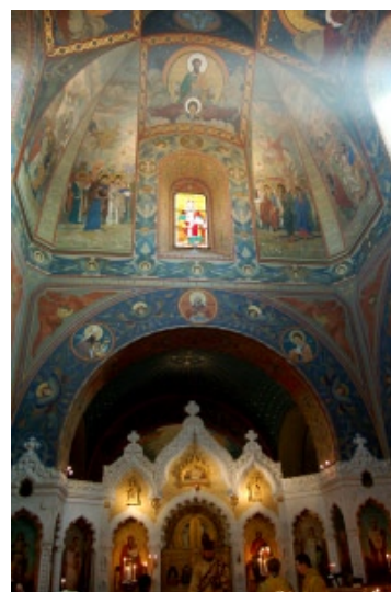
Chiesa di Firenze, veduta dell'interno: l'iconostasi