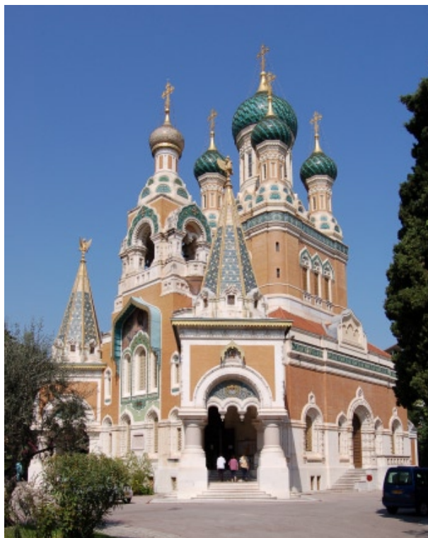
Nizza, Cattedrale S. Nicola

L'organizzazione ecclesiale dell'Esarcato costituisce un modello peculiare nel panorama dell'Ortodossia mondiale e si pone quale contributo concreto per il superamento del concetto di "diaspora", ormai inadatto a