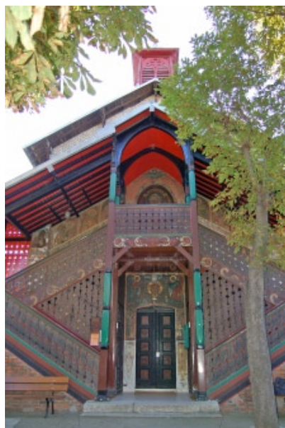
Parigi, Istituto Saint-Serge, Chiesa di San Sergio

Quest'anno l'Istituto conta 20 studenti per la licenza, 11 per il master, 14 dottorandi e 4 iscritti alla Formazione teologica e pastorale, a cui si aggiunge un certo numero di uditori liberi. Gli studenti provengono dalla Germania, Bielorussia, Bulgaria, Congo, Egitto, Etiopia, Francia, Ghana, Grecia, Italia, Libano, Macedonia, Polonia, Romania, Russia, Serbia, Turchia e Ucraina