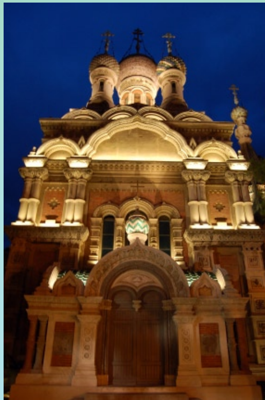
Sanremo, Chiesa di Cristo Salvatore, Santa Caterina Martire e San Serafino di Sarov