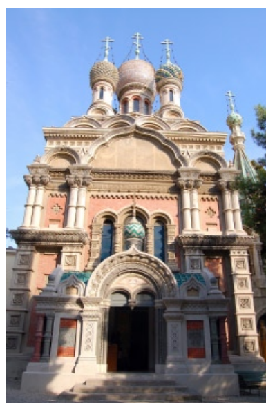
Sanremo, Chiesa di Cristo Salvatore, Santa Caterina Martire e San Serafino di Sarov